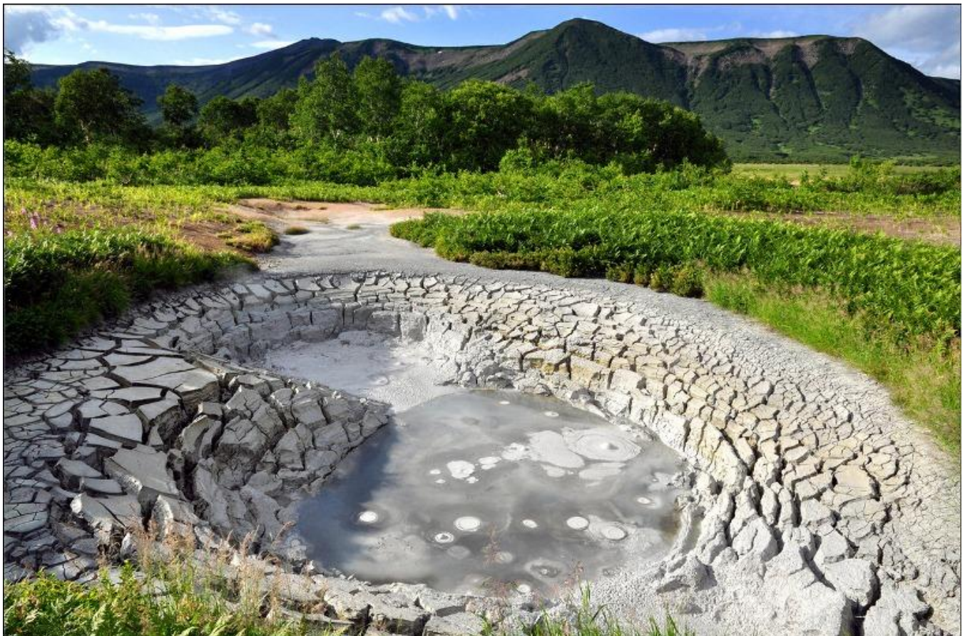
foto dole kaldera v.Uzon