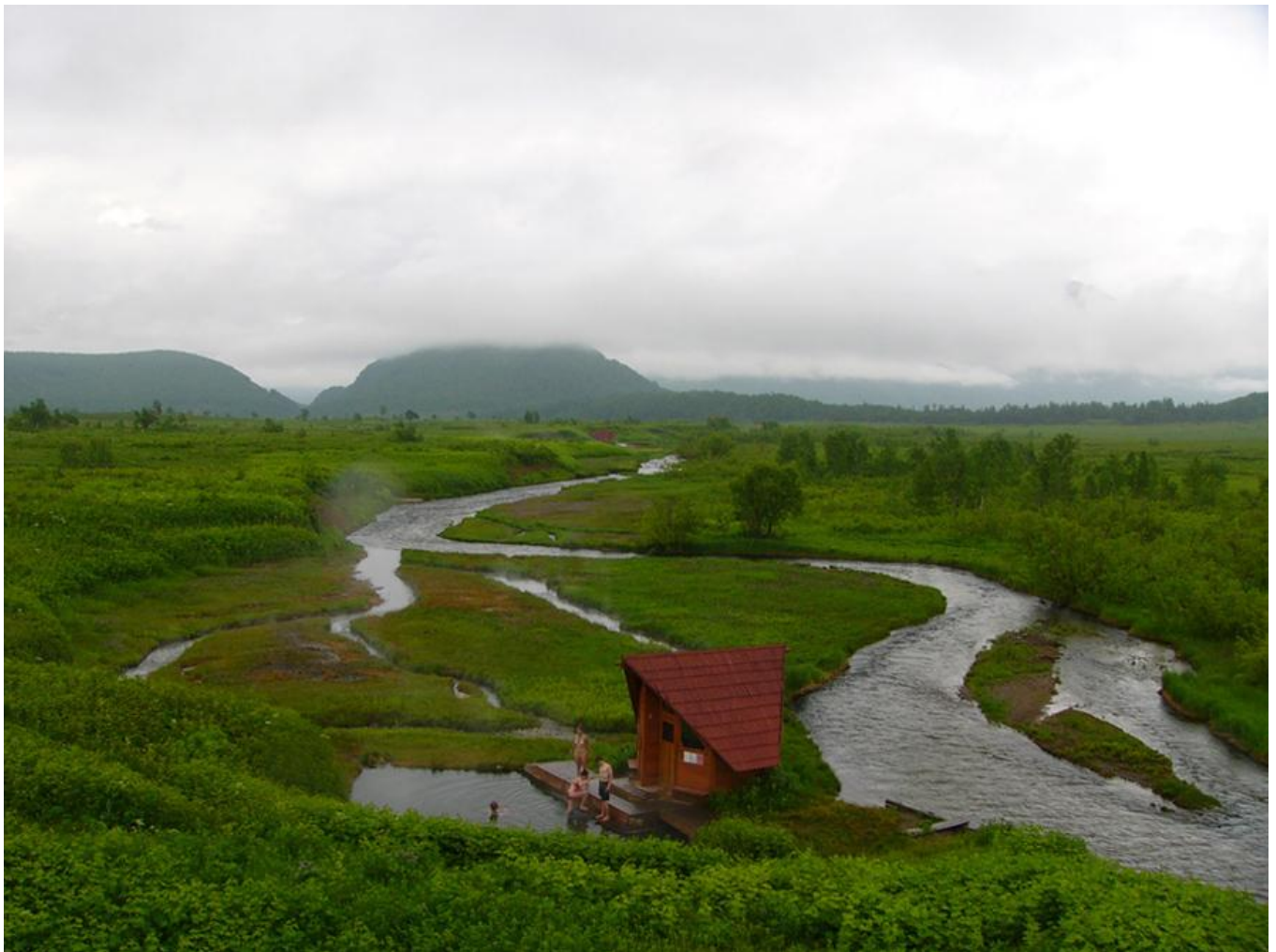
Termální přírodní louže v Nalyčevu