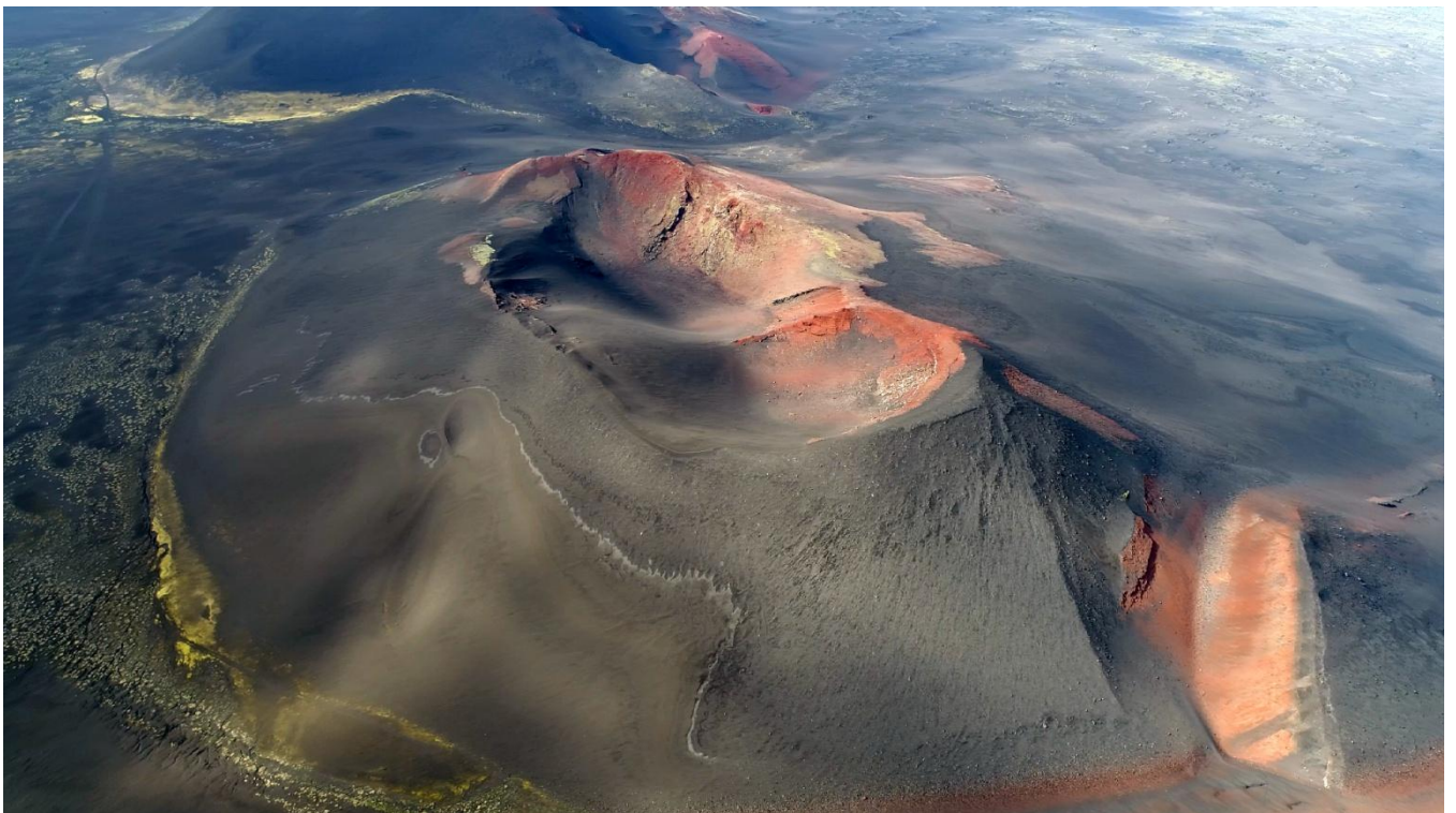
Konusy severního proryvu