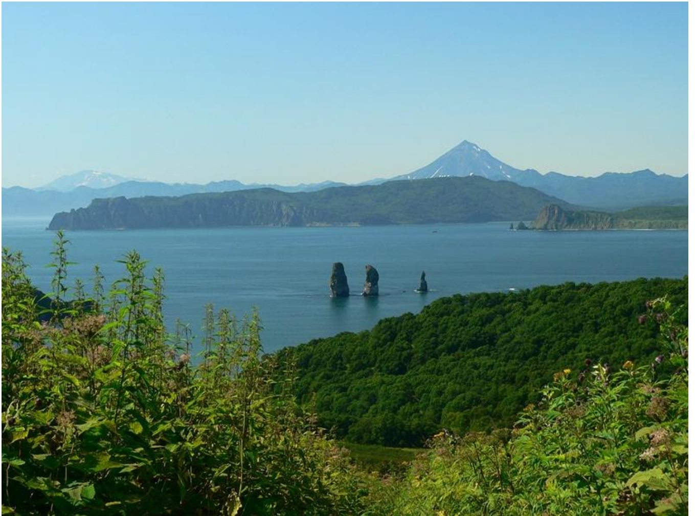
skály Tři bratři v Avačinském zálivu, v pozadí v. Viljučinský