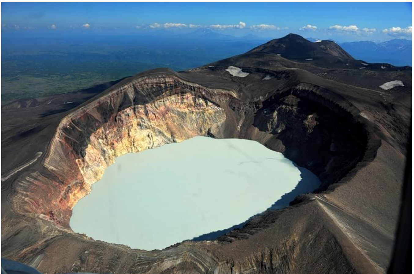
foto dole v. Malý Semjačik