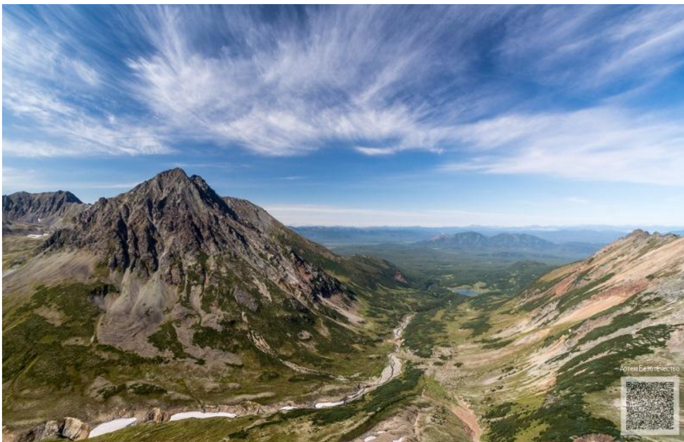
Údolí pod Vačkažecem

Odjezd v 8:00 ráno přes Jelizovo a potom pokračujeme na sever po asfaltové silnici asi 85 km a odbočujeme na lesní cestu která nás dovede k jezeru. Od jezera pokračujeme pěšky 2 km lesem a později výše přes nevelký stláník do údolí pod vyhaslým vulkánem Vačkažec. Pokračujeme dále po kamenité cestě v jejím konci následným ostrým stoupáním dojdeme až do našeho cíle, polootevřeného kráteru. Pod kráterem se nachází nevelký horský vodopád. Na zpáteční cestě je možné navštívit ještě další kaskádový vodopád s krásným kaňonem. Celkový trek zabere časově tam i zpět asi okolo 6-7 hod. Trek je nenáročný. Krajina nejednotvárná s pěkným výhledem do okolní krajiny. Po návratu se možno vykoupat v jezeru. Navečer se vracíme do PK.