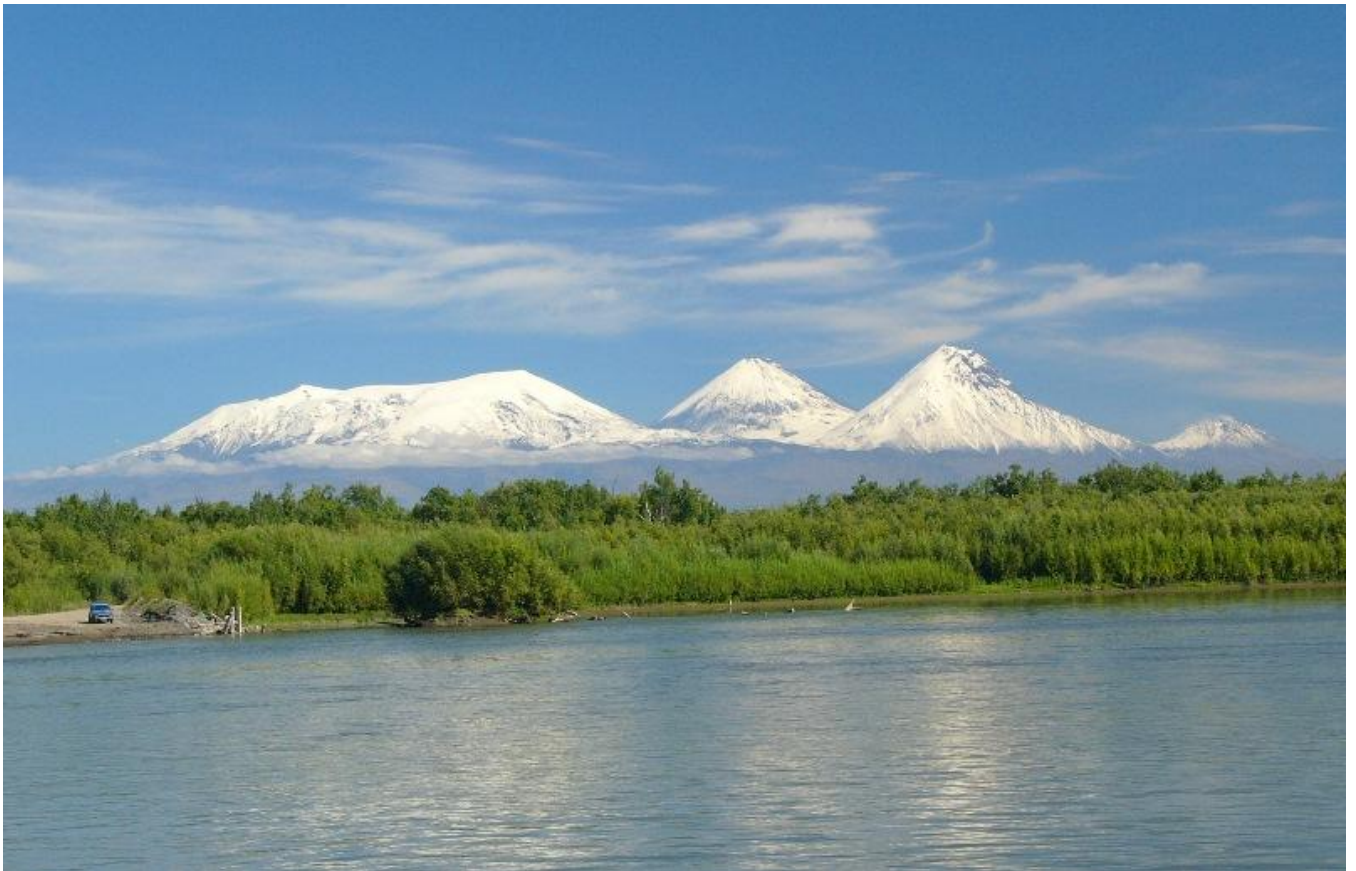
Ključevská skupina vulkánů