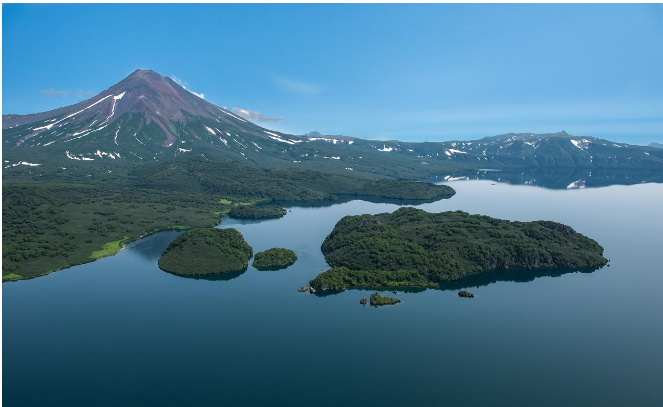
Kurilské jezero - délka 12,5 km , šířka 8 km, maximální hloubka 316 m

Světově známé jezero tím že se v této oblasti zdržuje až nezvykle velké množství medvěda hnědého kamčatského ,který má na tomto místě ideální podmínky pro velké množství lososa Něrky, která je jeho součástí potravy.Nejlepší období pro návštěvu tohoto turisty velmi navštěvovaného místa je srpen a první polovina září, kdy se to tu medvědy doslova hemží,neboť se zde navrací zakončit svoji životní pouť a vytrít právě tento losos.Každým rokem se jich tu vytírá na 2 miliony.V toto období hojnosti ryby je možnost jich pozorovat na desítky kusů.Podle posledních údajů se pohybuje koncem léta na jezeře asi 200 medvědů ,v jeho okolí a přilehlých prostorách jezera až na 1000 medvědů.Na teritorii vás po příletu doprovází místní ozbrojený inspektor,který se stará o bezpečnost a zároveň vám podává odborný výklad.Jsou zde speciální zvýšené pozorovatelný ze kterých můžete bezpečně a spokojeně pozorovat a fotografovat naše medvědy. Výlet vrtulníkem- Letí se vrtulníkem MI-8,je až pro 22 osob a letí s vámi průvodce který během letu hovoří o místech které prolétáte.V průběhu letu se prolétá nad nádhernou kalderou vulkánu Ksudač ve kterém se nachází dvě jezera .Po exkurzi na Kurilském jezeře je zastávka na Chodutce,termální řece ve které je možnost se krátce okoupat.Na tuto exkurzi se vylétá ráno okolo 10-11 hod dopoledne podle počasí, návrat je ve večerních hodinách 21-22 hod.K místu odletu vás odveze autobus a zpět taktéž.