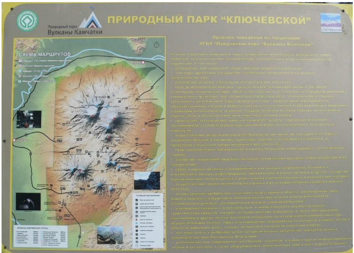
Мапа Ključevské skupiny vulkánů