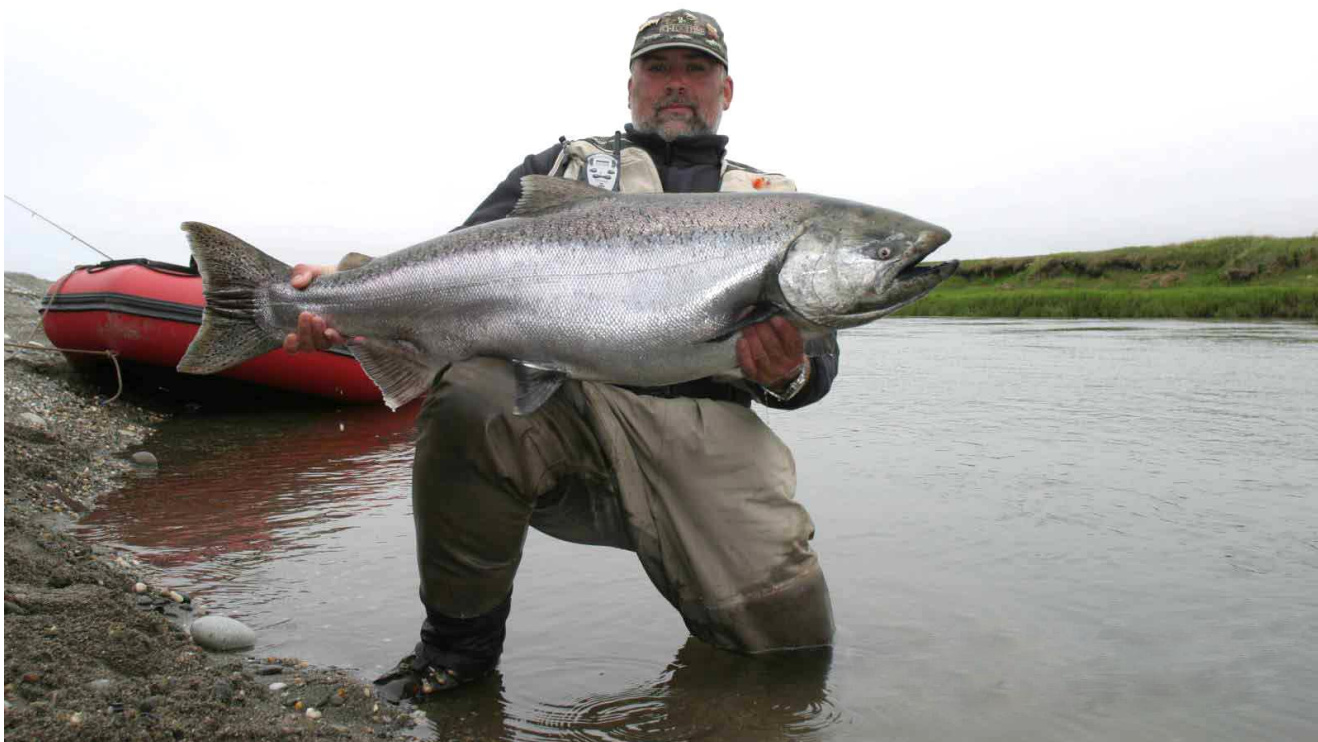
Losos Čaviča- královský losos

9.-10.den - 19.-20.8 -Vulkány Mutnovský,Gorely a Rodnikovi term.prameny.