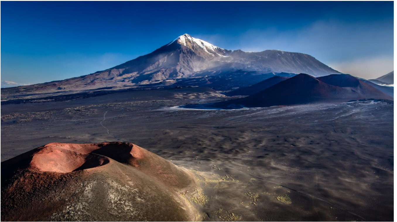
foto níže zleva v.Kameň a v.Ključevský