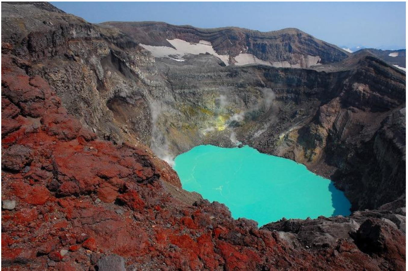
sirné jezírko v.Gorelaja