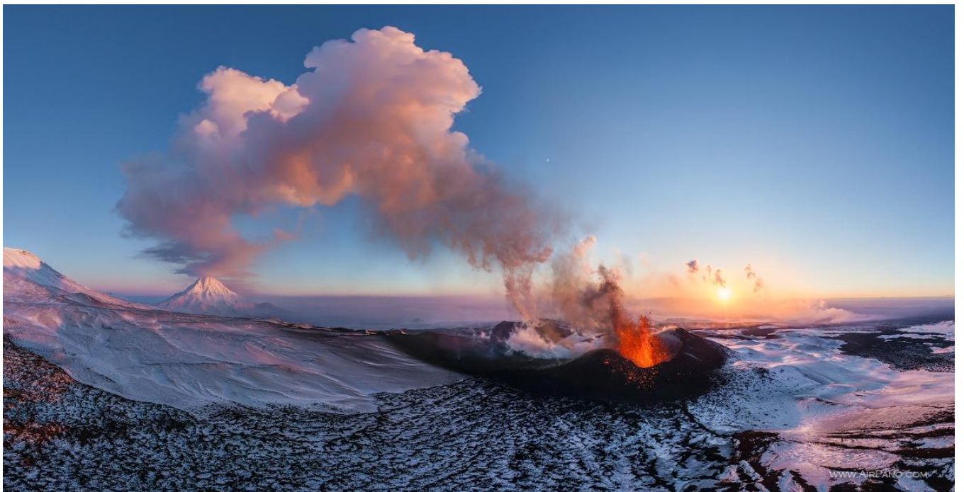
Erupce na Tolbačiku 2012 - 2013