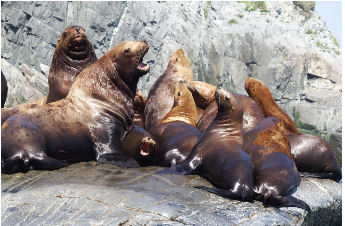
foto dole Lachtani