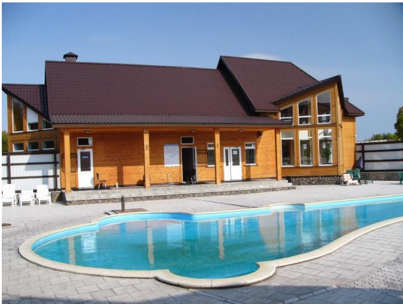
termální bazén Antarius v Paratunce

Poslední den před odletem se podle situace budeme věnovat prohlídce města,obchodů,tržnic, nákupem dárků,suvenýrů a místních specialit.Zbude-li čas je možné navštívit některý z termálních bazénů v Paratunce, která je vzdálená od Petropavlovsku Kamčatského asi 50 km.Možno použít přímého autobusového spoje přímo z města.