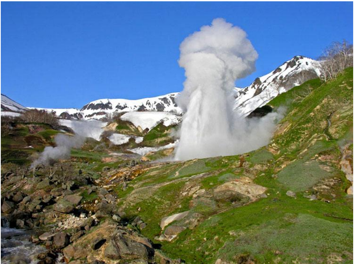
foto dole gejzír Velikán