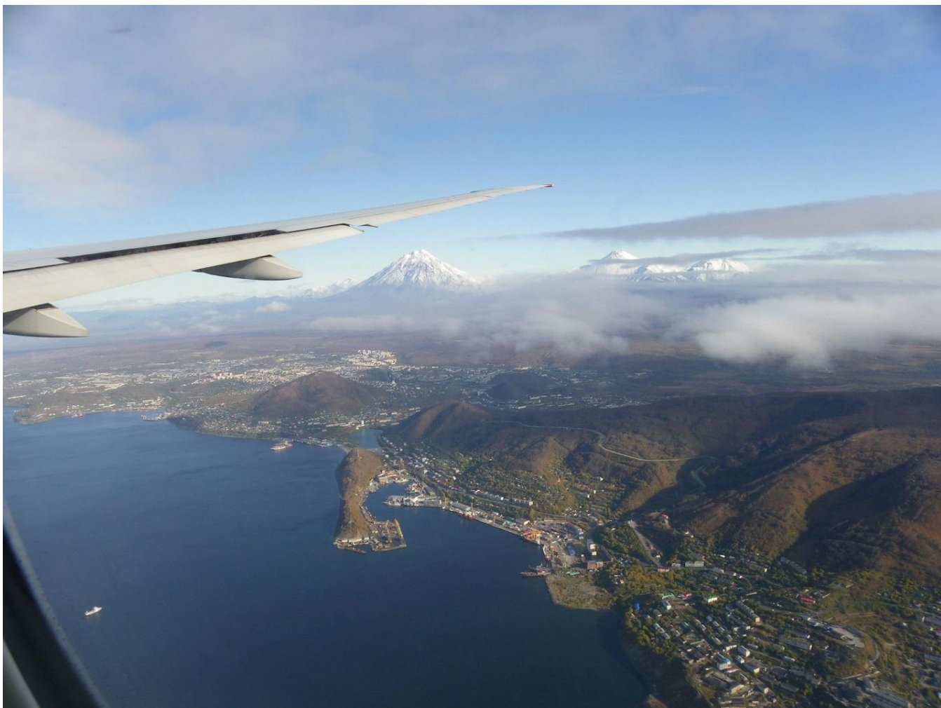
Avačinský záliv a Petropavlovsk Kamčatský