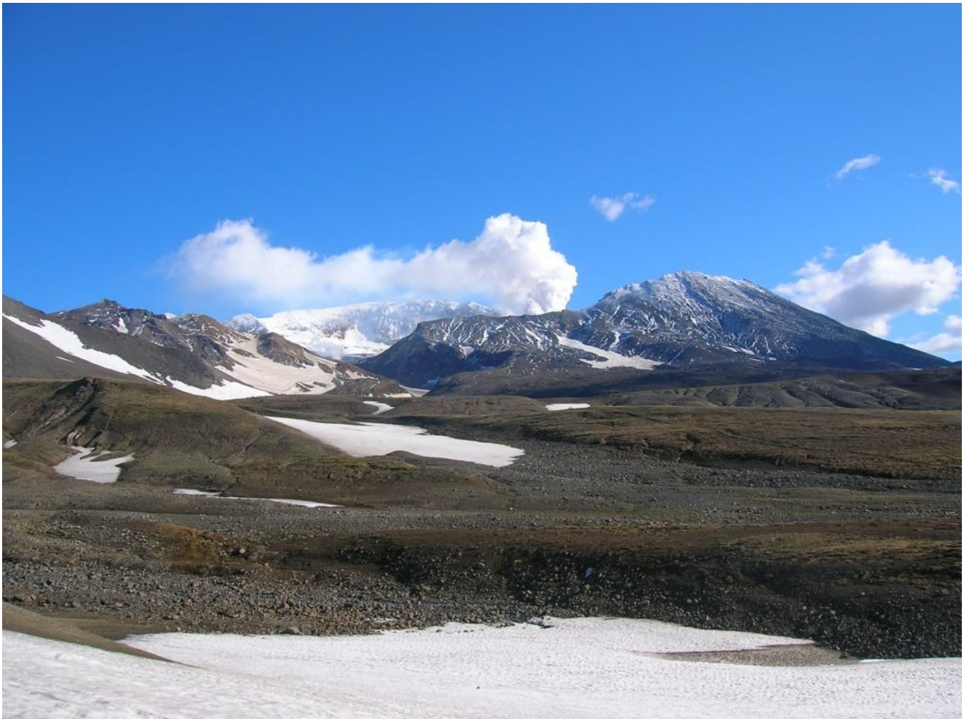
v. Mutnovský - pohled z plata od v. Goreli