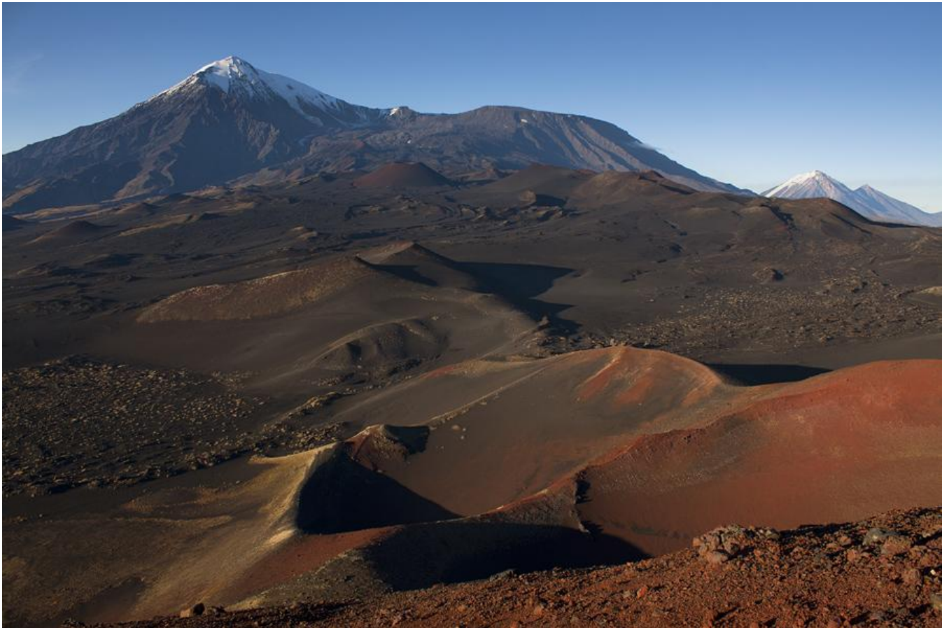
Severní konusy -Tolbačinský dol