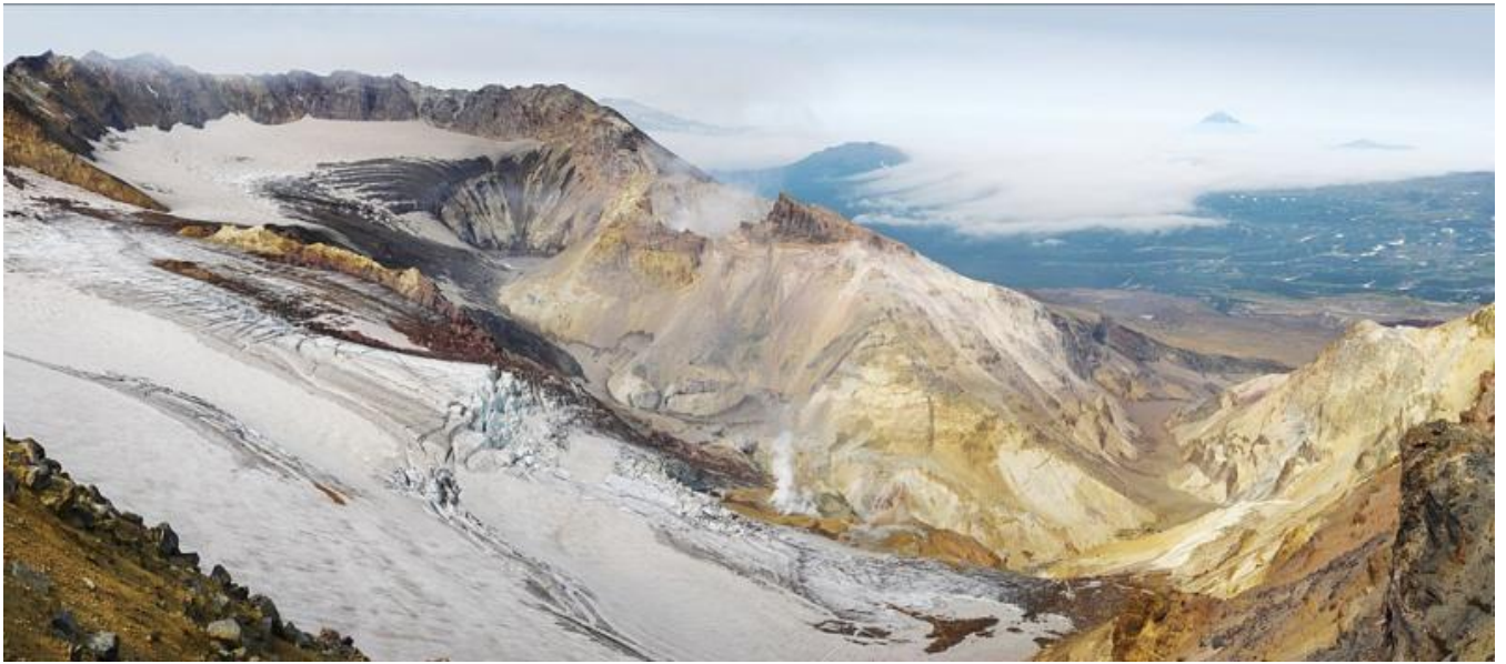
kráter v. Mutnovského