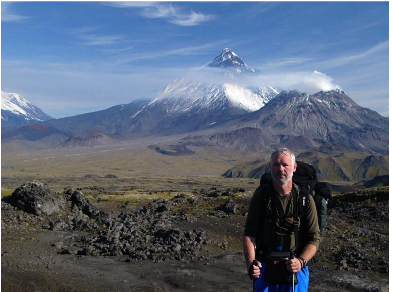
Nahoře zleva v.Kameň a v.Bezymjanyj