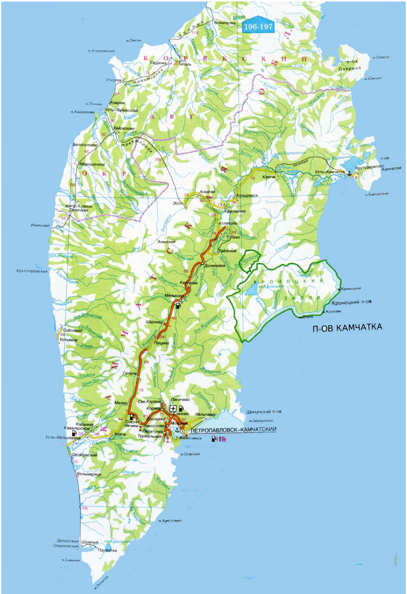
Silniční síť Kamčatky