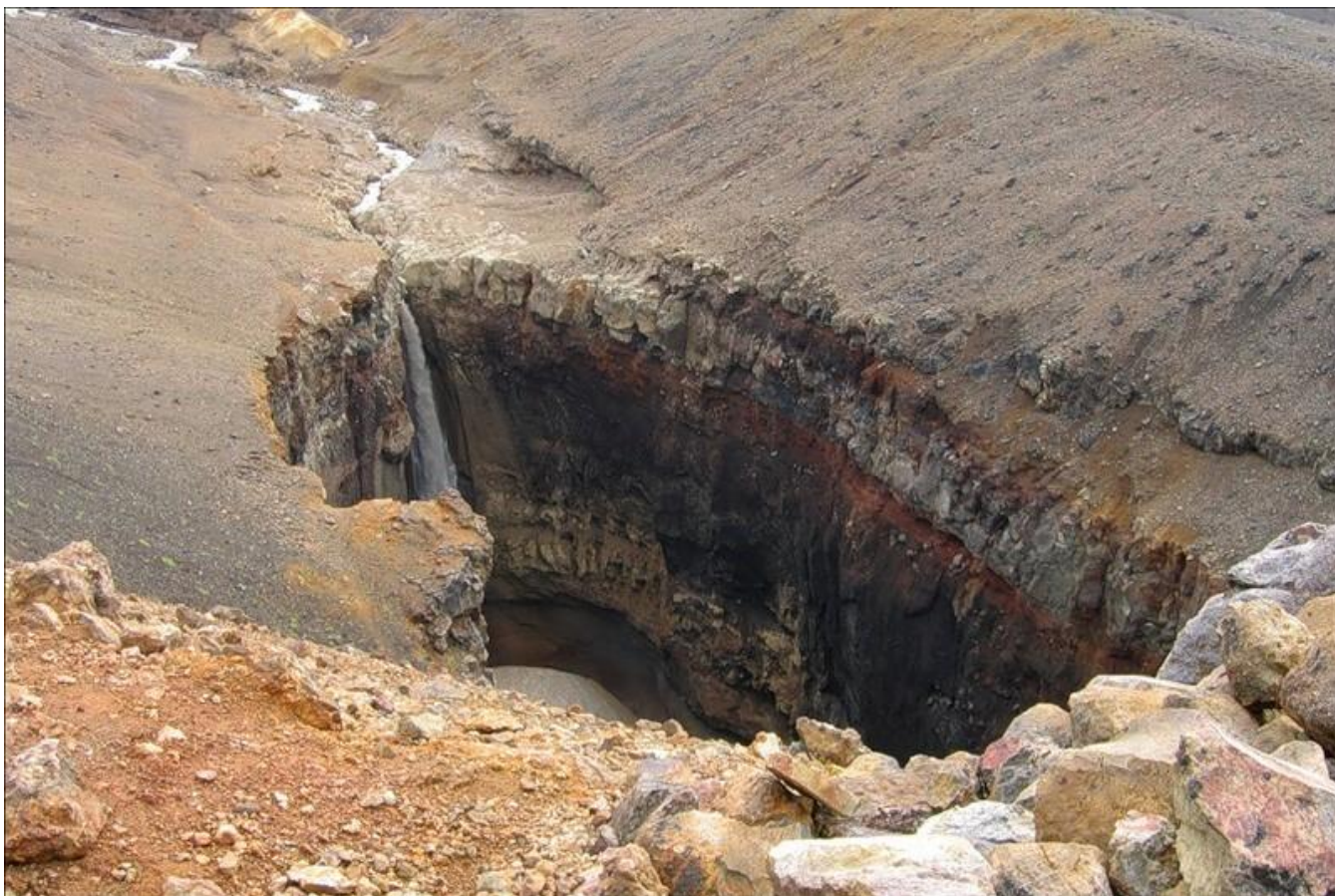
vodopád na Opasném kaňonu