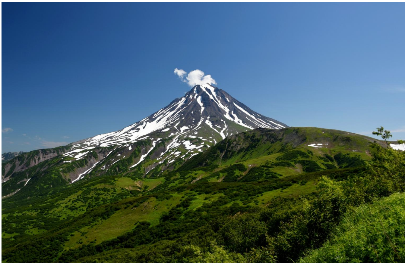
v. Viljučinský - průsmyk

S nastupující výškou a se úsek stane strmější, přicházíme na vrchol okraje hlavního kráteru ve kterém je jezero a odsud se odkrývá pohled na celý vulkán. Výstup trvá asi 4 hod. Za příznivých podmínek je z vrcholu vidět v. Mutnovský, v. Opala, v. Viljučinský a za ním v dále v. Korjacký a v. Avačinský. Vulkán Gorelaja je celkem utvořen z 12 kráterů. Pět z nich je pospolu, tyto obejdeme a zabere nám to časově okolo 2 hod. Ostatní se nachází v okolí těchto 5 hlavních. Nazývají se postraní. Na návrat dolů trvá přibližně asi 2-3 hod. Dole nás čeká občerstvení po náročném dnu. Potom odjedeme vykoupat na teplé Rodnikovi termální prameny a odsud se už potom přímo navracíme do PK.