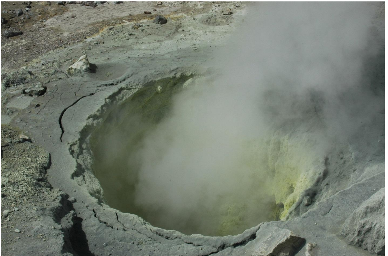
fumarola v kráteru Mutnovky